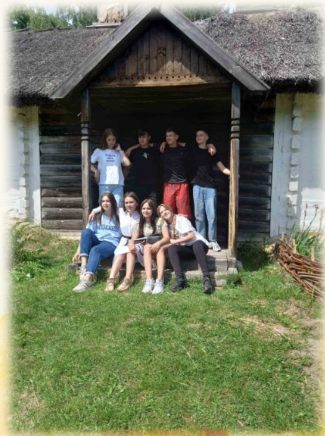
Музей під відкритим небом с. Пирогове