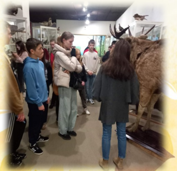
23 Краєзнавчий музей