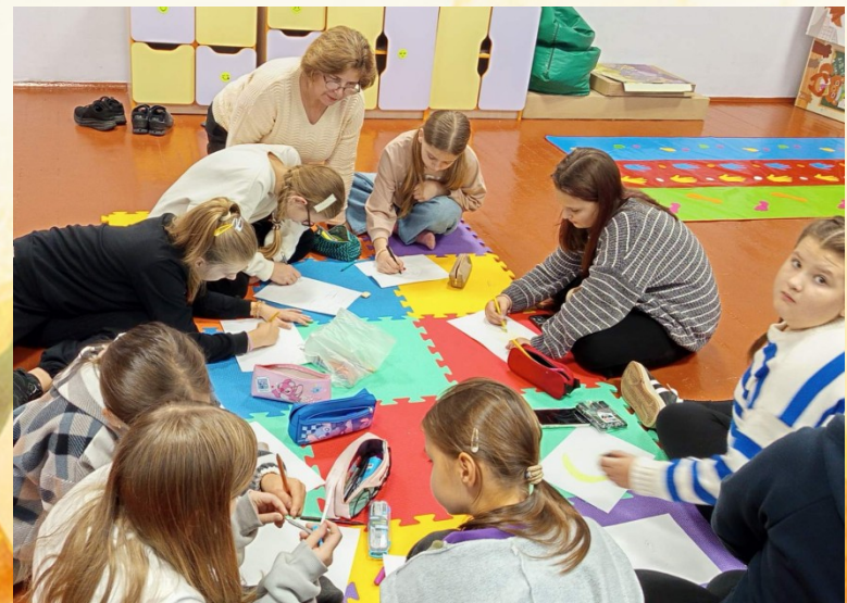
«Дбаємо про своє серце та думки»