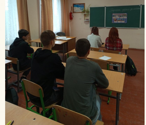
«Безпечна дорога до школи»