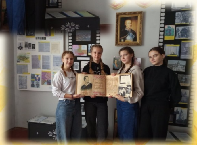
Робота над проектом «Хайку»