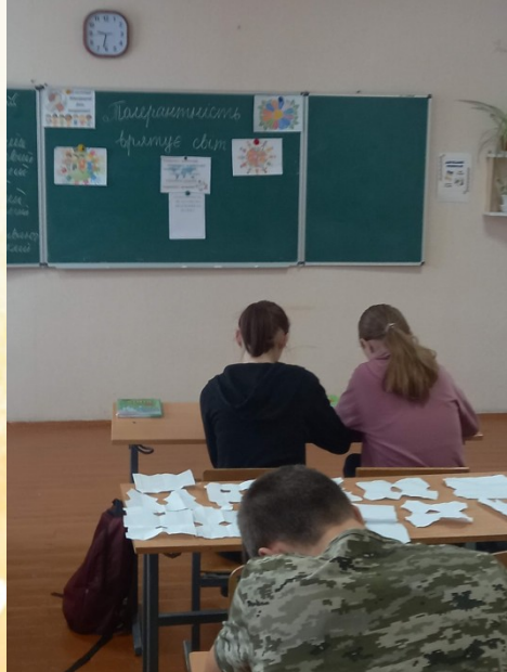
«Толерантність врятує світ»