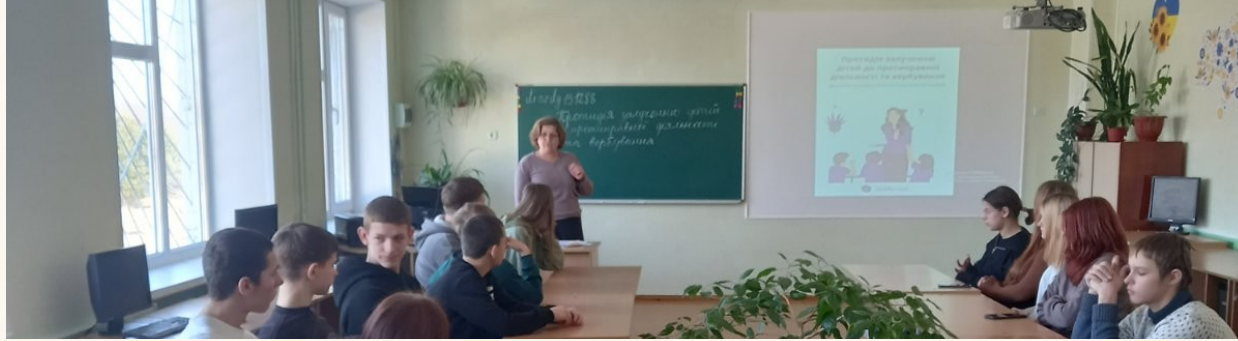
«Протидія залучення дітей до протиправної діяльності»