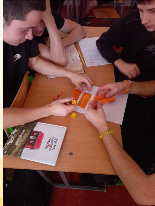
«Ми обираємо життя без насильства»