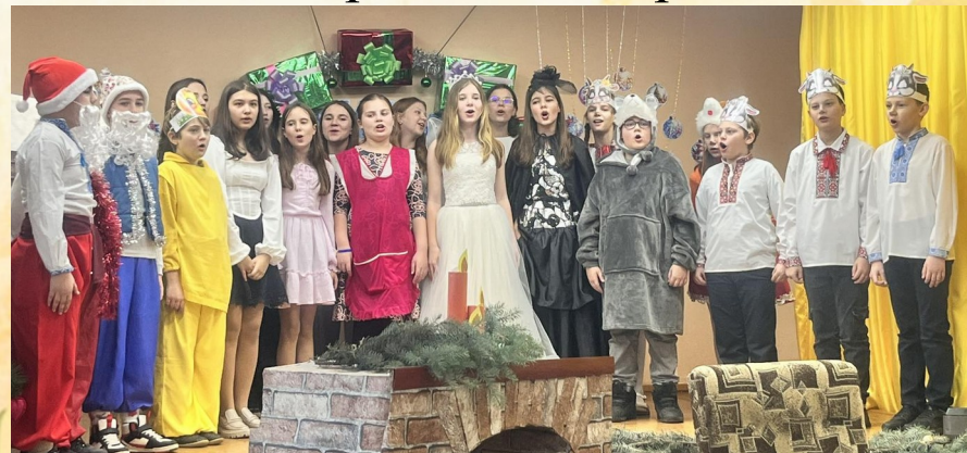
П'еса «Пригоди Насті в Казковій країні»