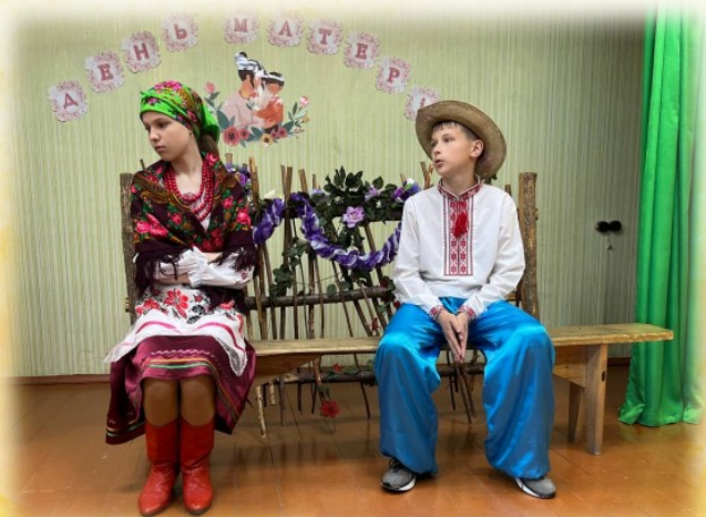
П'еса «Язиката Хвеська»