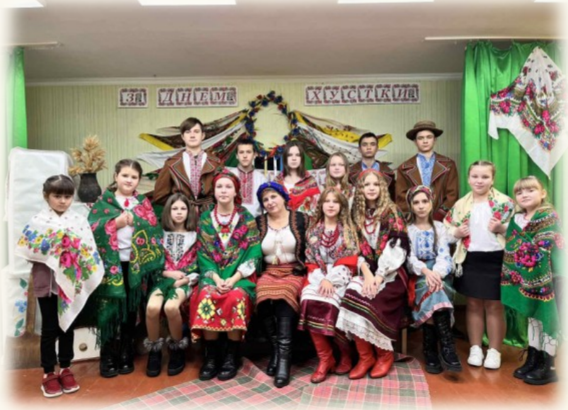
«День Української Хустки»

На сцені ми вчимося не лише грати, а й жити