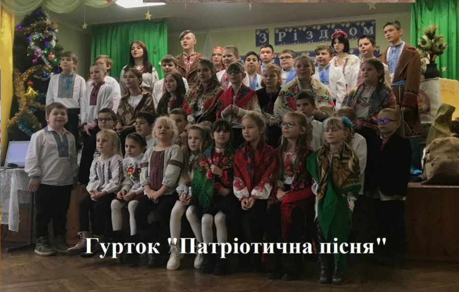
Гурток "Патріотична пісня"